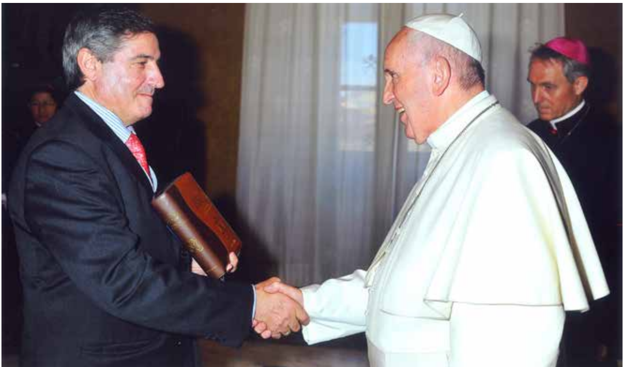
Elías con el papa Francisco en la entrega de La Biblia. Libro del Pueblo de Dios .

Doy las gracias a todos con los que he podido compartir esta apasionante aventura, muy especialmente a todo el equipo humano de EVD. Gracias a los verbitas de aquí y de allá; que todos juntos sigamos ilusionados y haciendo posible que la alegría del Evangelio siga llenando el corazón y la vida de los que se encuentran con Jesús.