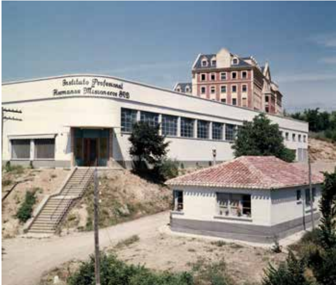
Nuevo edificio (1957).