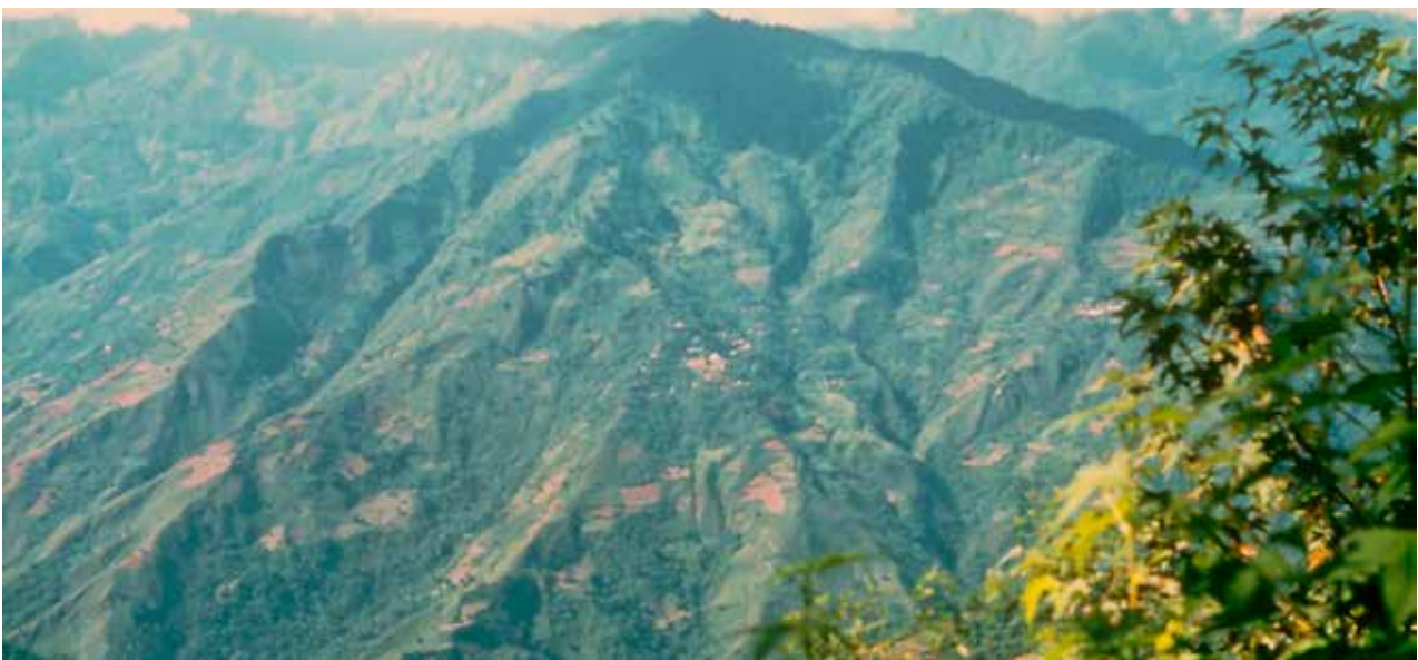
Nuestra parroquia de Yagavila desde Yaée, en la Sierra Juárez de Oaxaca.

La respuesta nos la da «el silencio del príncipe Myskin, que con infinita compasión de amor se encuentra junto al joven que está muriendo de tisis a los dieciocho años». Fue lo que Jesús de Nazaret hizo y nos dijo que hiciéramos.