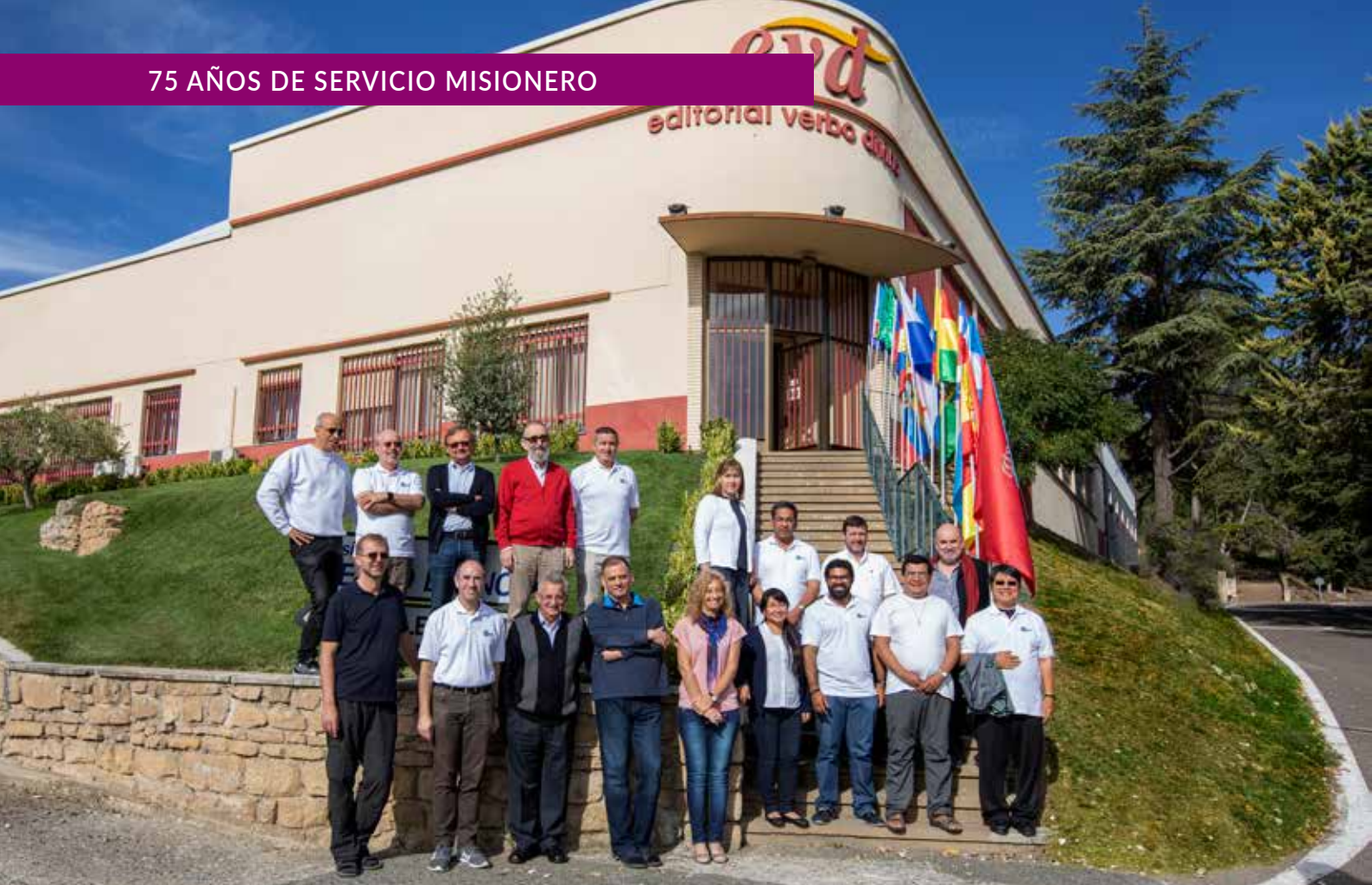
Reunión del Grupo Editorial Verbo Divino en septiembre de 2019.