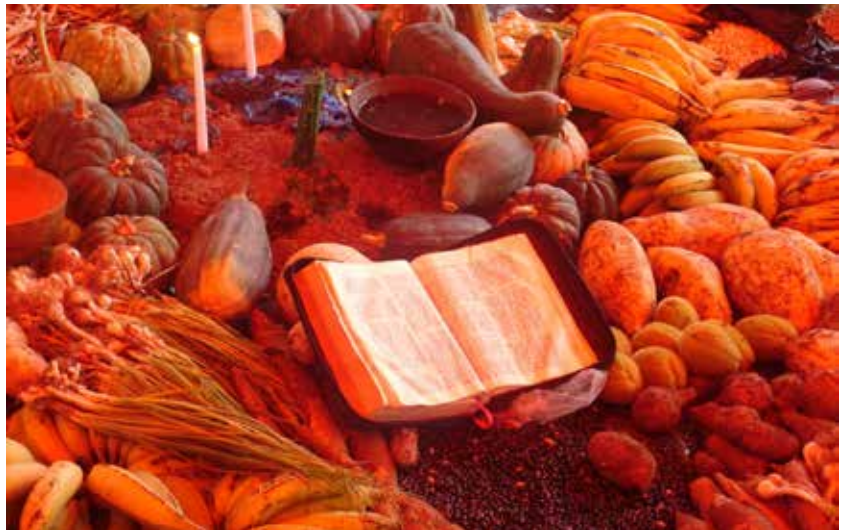
La Biblia, el fruto de los frutos para los indígenas choles de Chiapas, México.

Seguramente san Arnoldo Janssen, nuestro fundador, estará disfrutando con lo que el papa