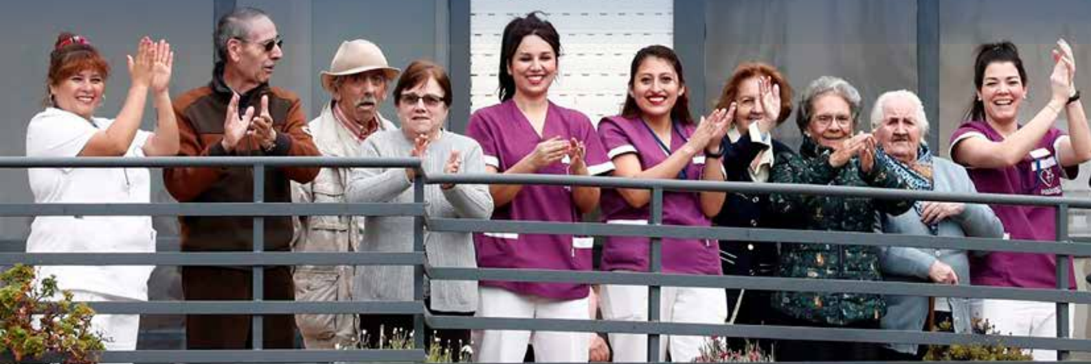
Empleadas y residentes confinadas y sonrientes en la Residencia San Jerónimo de Estella.